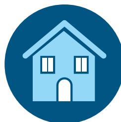
生病时待在家里； 避开他人