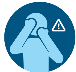
避免用未洗过的手触碰眼睛、 鼻子或嘴巴