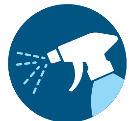
清洁和消毒经常接触的 物体和表面