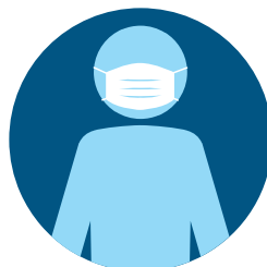
外出在公共场所时， 请佩戴布制面罩