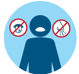
近期丧失味觉和/或嗅觉

COVID-19 的其他症状可能包括：疲劳、肌肉酸痛、头痛、喉咙痛、鼻塞或流鼻涕、恶心或呕吐或腹泻。