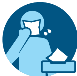
咳嗽或打喷嚏时用纸巾或袖子捂住口鼻